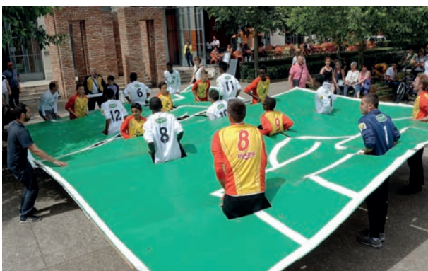
Projet performance avec l'AS Duchère au maCLYON

Cet engagement vise à permettre à chaque personne d'accéder, de contribuer et de participer de façon égale aux disciplines et métiers artistiques, culturels et patrimoniaux afin de développer son plein potentiel et concourir au développement durable, social et inclusif de la cité.