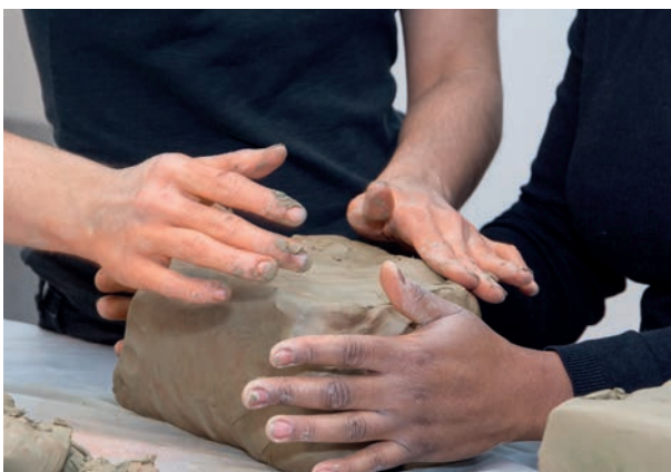
PasserElles Buissonnières», projet du maLYON

La coopération témoigne de la prise en considération des interdépendances au sein du secteur culturel, et plus largement entre la culture et les autres secteurs dans lesquels interviennent les politiques publiques.