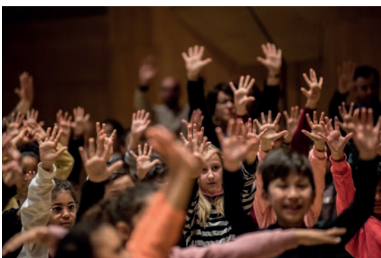
Démos (Dispositif d'éducation musicale et orchestrale à vocation sociale) à l'Auditorium-Orchestre national de Lyon

Les institutions et lieux culturels ont vu leur relation au public bouleversée par l'essor des nouvelles pratiques liées au numérique, bouleversement amplifié et accéléré par les confinements et fermetures d'établissements culturels lors de la pandémie de Covid-19. Ces nouvelles pratiques ont déplacé les questions de démocratisation culturelle vers des enjeux de démocratie culturelle.