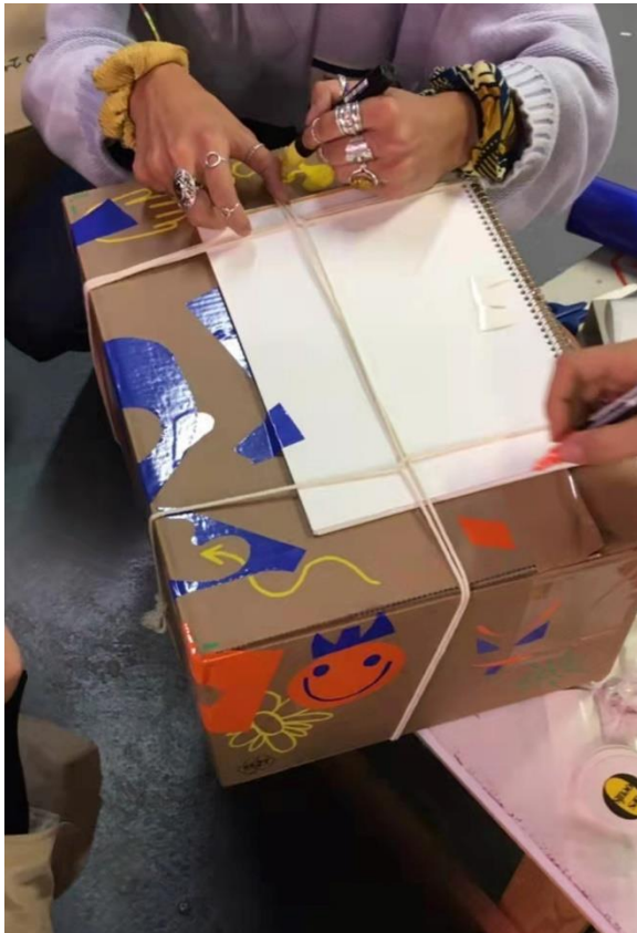
the missing box , correspondance entre Ensba Lyon et Delli Lisbonne pour le projet TIME - THE INSTITUTE OF MIRRORS AND ECHOES