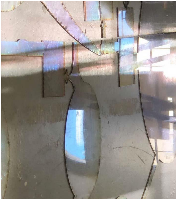
Recherches autour de La Reproduction de Pierre Bourdieu pour le projet TIME - THE INSTITUTE OF MIRRORS AND ECHOES