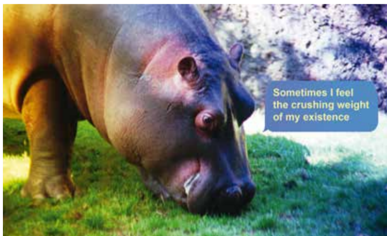
Basim Magdy, Production en cours, 2019 ©Basim Magdy

Mulhouse Art Contemporain est partenaire de La Kunsthalle.