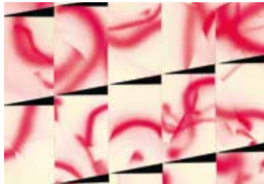
Palazzo Mutation #1, 2019 - 21 x 29, 7 cm - Aérographe