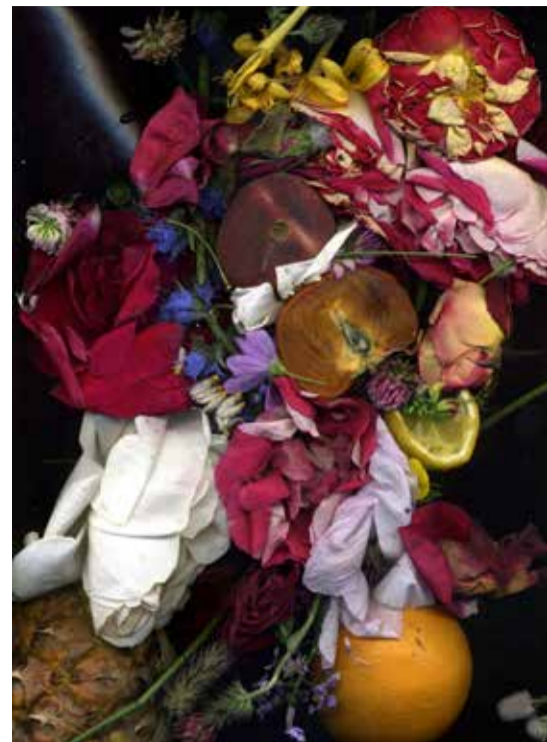
Scent of Light I © Maria Malmberg