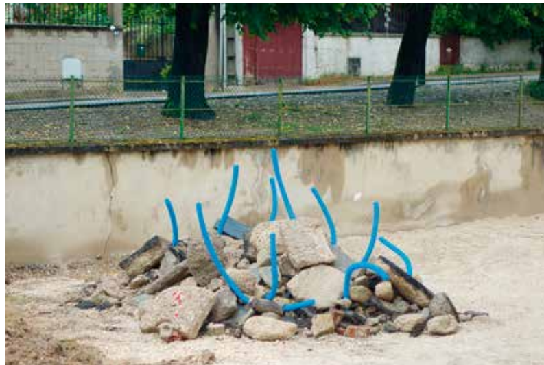
Laurent Lacotte, Bouquet de chantier, 2016 – Tuyaux de construction en plastiques trouvés sur un chantier et réagencés sur tas de pierre et gravas, Migennes.