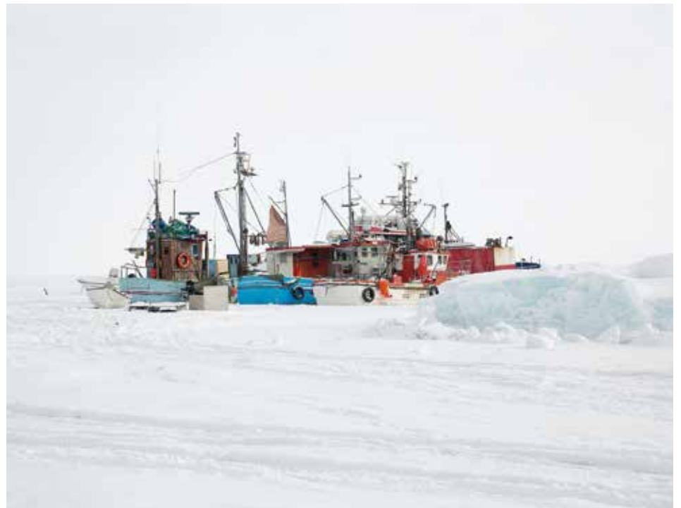
Ummannaq, © Camille Michel / Hans Lucas

Dimanche 11 juin à 15h Jeu de loi "Parcours des migrants", en partenariat avec l'association La Cimade. Entrée libre