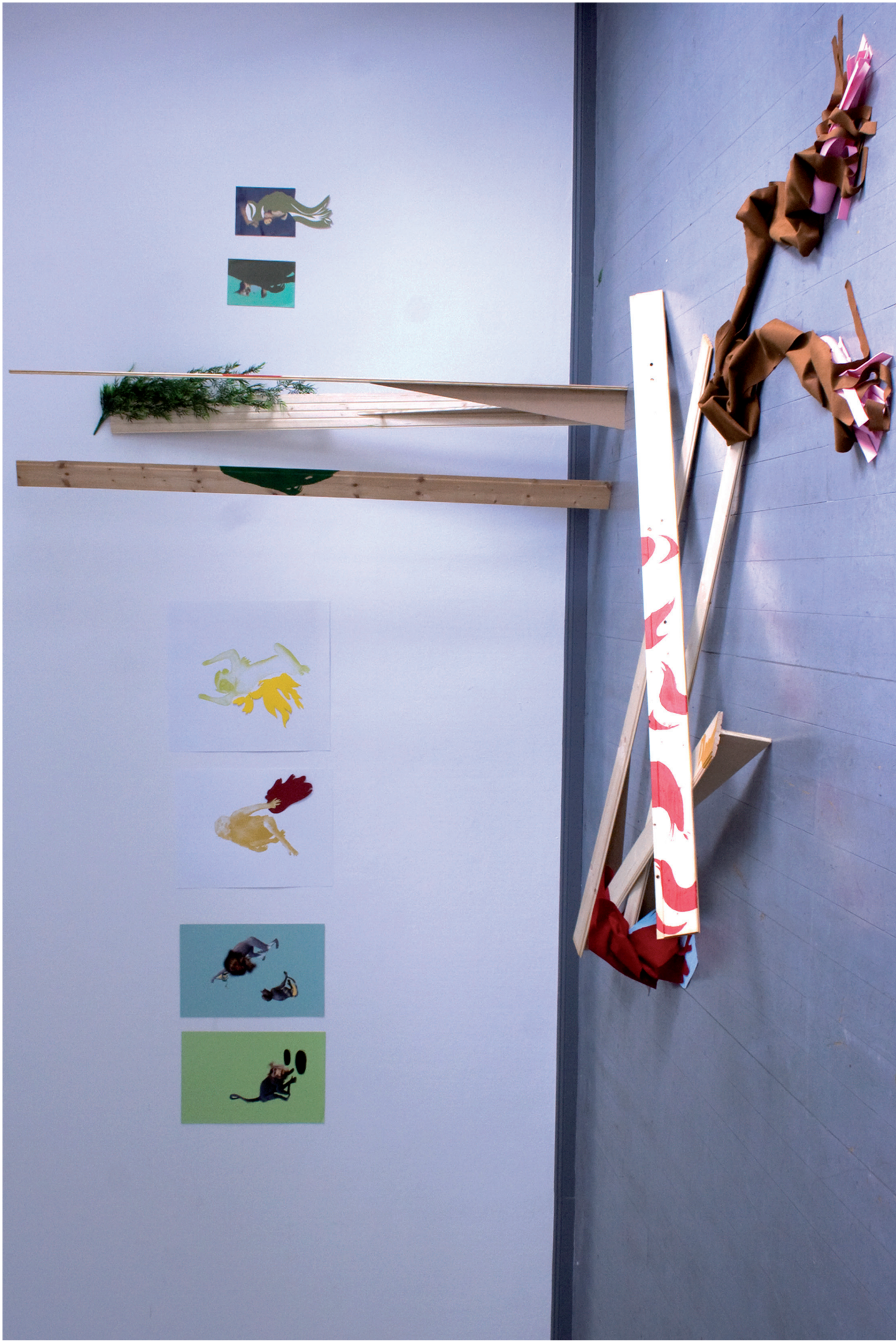
Das Affenspiel (un jeu de singes) (2009) 4 collages numériques dimensions variables, 2 sérigraphies, 70 x 60 cm, 7 lattes de lambris 220 cm x 20 cm, plante, mousse et feutrine, couleurs et dimensions variables.