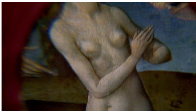
Maïté Marra, Harmonie des Sphères , 2019, vidéo HD, couleurs, muet, 6'23''

Présentée le 12 novembre à la Fondation d'entreprise Ricard.